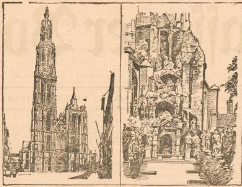
Die St. Paulskirche mit dem Calvarienberg in Antwerpen.