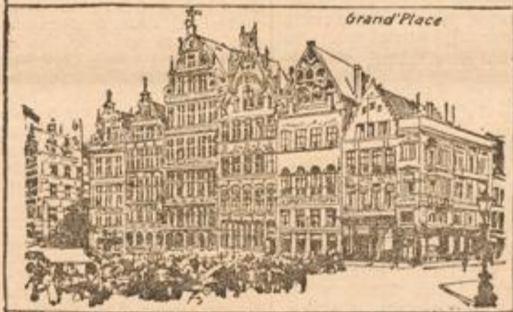
Bilder aus Antwerpen