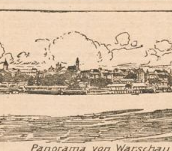
Panorama von Warschau.

frischen, wieder mit der Mutter Erde, wie schon so oft, vorlieb nehmen würden. Aber es kam noch schlimmer! Unser schwaches Korps hatte sich anscheinend doch zu weit vorgewagt, wurde von den starken feindlichen Kräften nebst seinen Forts zu stark bedrängt und mußte seine vorbereitete Artillerielinie etwas zurücknehmen; wir wurden deshalb um ca. 5-6 Km. zurückbeordert bis Luneville.