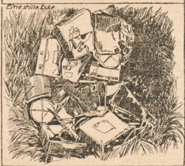
Von d. Franzosen auf d. Flucht weggeworfene Ausrüstungsgegenstände. Kriegsbilder aus Frankreich.